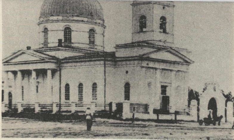
Никольский казачий собор. Фото 1900-х гг. (ГОИЛ музей).

Кровных коней запрягайте в дровни! Графские вина пейте из лужи! Единодержцы штыков и душ! Распродавайте — на вес — часовни, Монастыри — с молотка — на слом. Рвитесь на лошади в божий дом! Перепивайтесь кровавым пойлом!