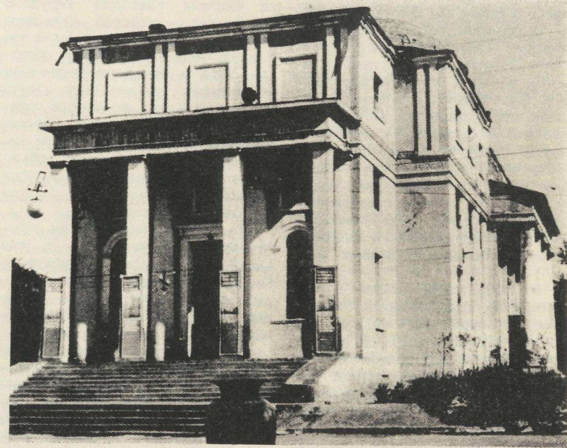
Кинотеатр Победа, ок. 1950 г..